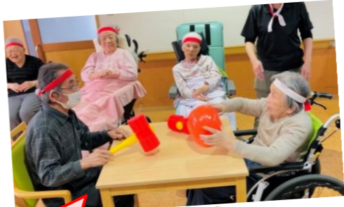
たたいて・かぶって・ジャンケンポン

運動会を開催しました☆ ボール送りや玉入れ競争。障害物リレーではパン食い競争に輪投げや魚釣りをしてから借り物競争と大盛り上がり♪ 『たたいて・かぶって・ジャンケンポン』では、真剣ながらも皆さまの優しい一面が見えました😊